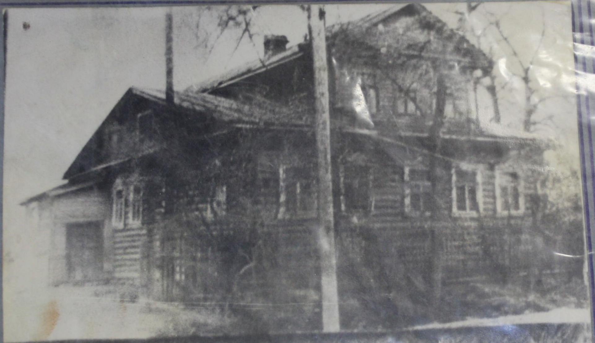
Дом в селе Шум, где в короткие часы Гидоика нахед, илик в Слань в Н Д - командир Лаврентий Родов Сосна и Лиховенко