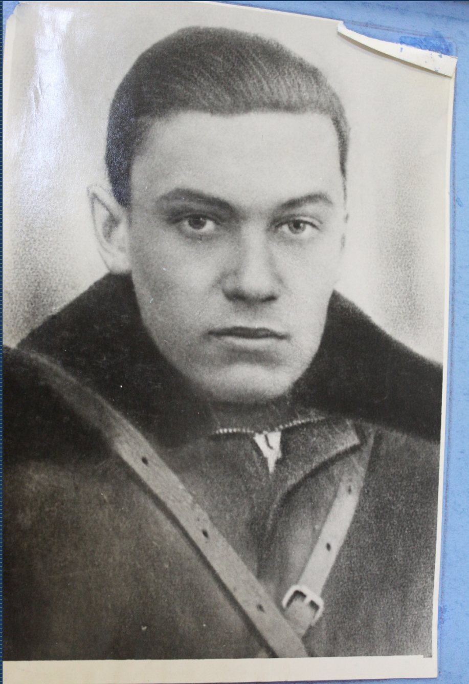
Войска и моряки