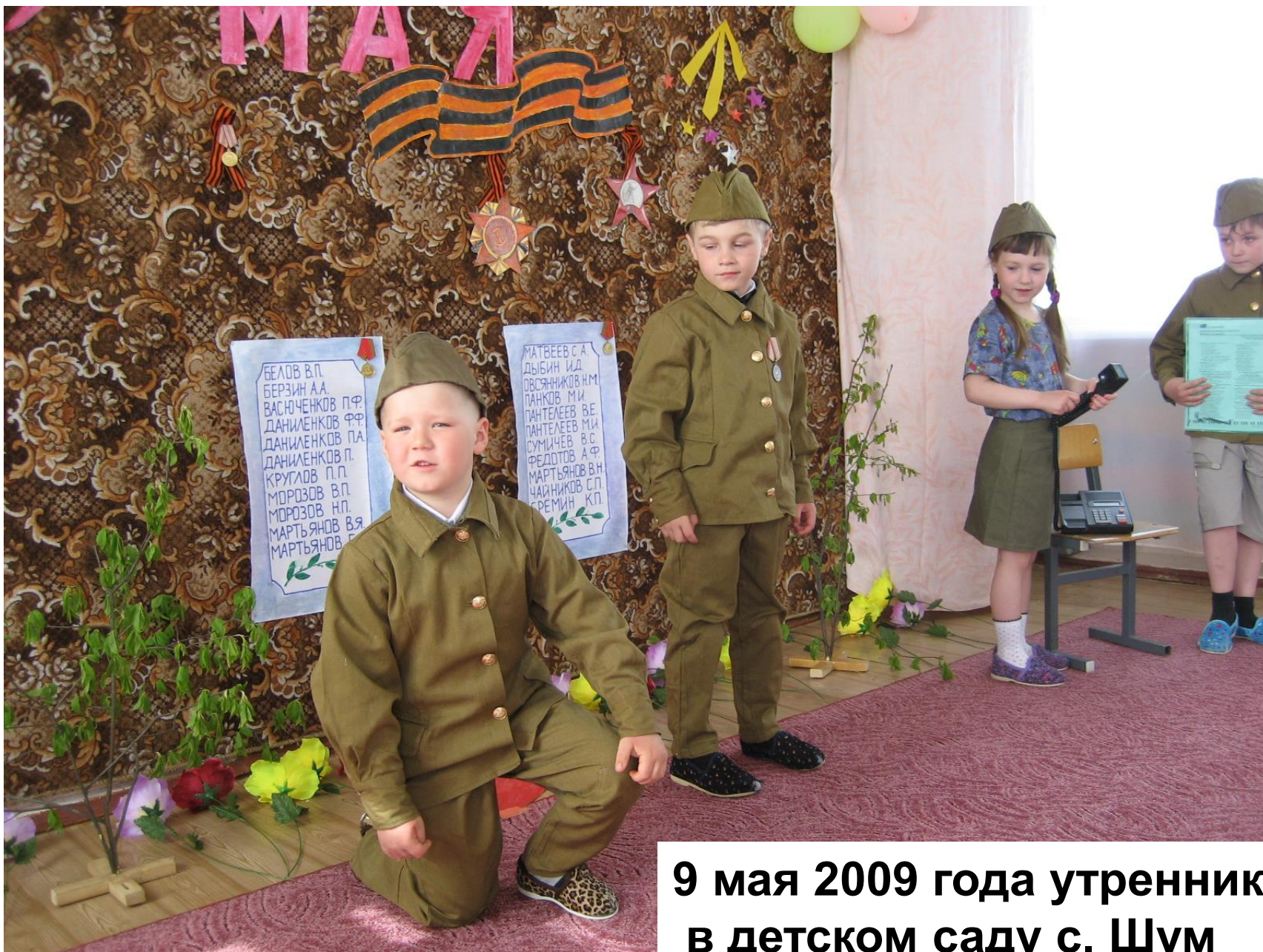
9 мая 2009 года утренник в детском саду с. Шум