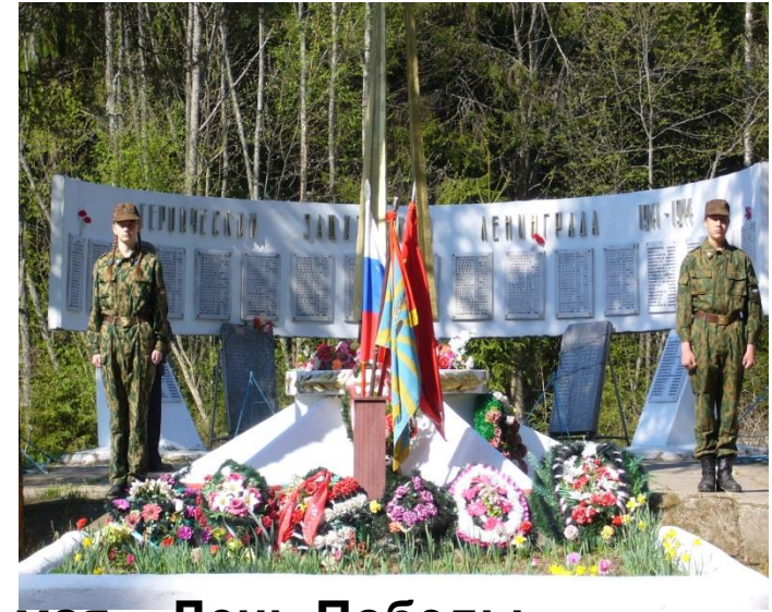
9 мая – День Победы