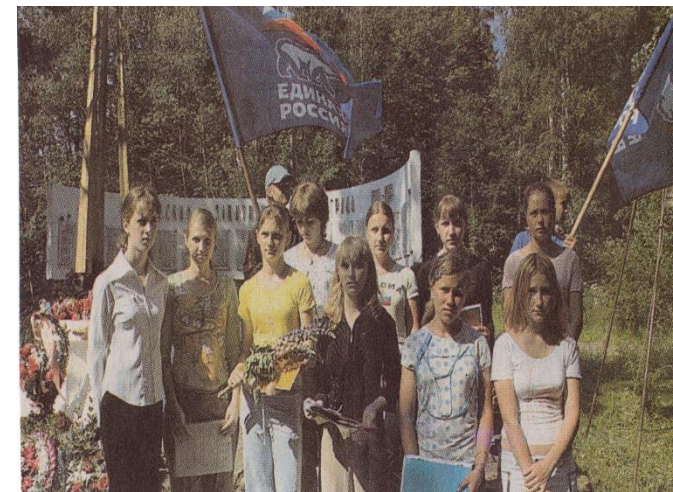
22 июня – Колокола памяти.