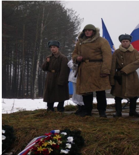
22 ноября- митинг, посвященный открытию Дороги Жизни.(В Дусьево у «полуторки»)