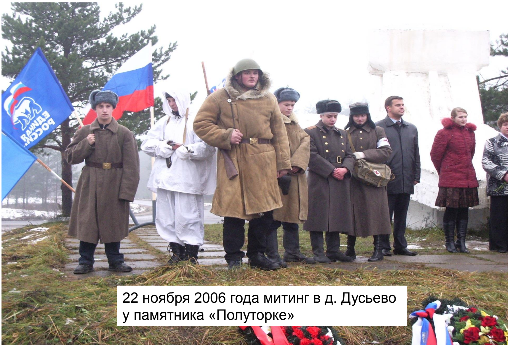
22 ноября 2006 года митинг в д. Дусьево у памятника «Полуторке»