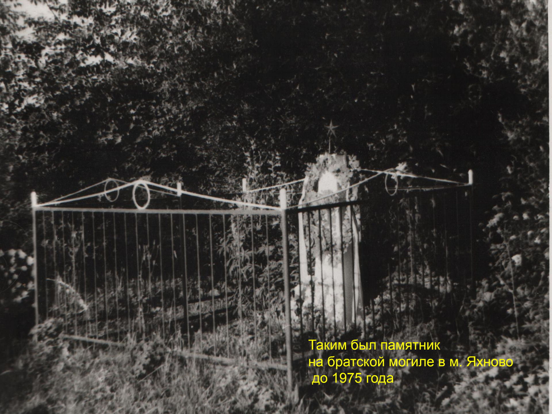
Таким был памятник на братской могиле в м. Яхново до 1975 года